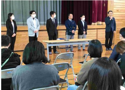
【総会：旧役員さんのご挨拶】

4月26日、授業参観の後、PTA総会が開催されました。大勢の保護者が参集され、本校PTAの結束力の強さを感じられるスタートとなりました。新PTA会長からは、「創立150周年をみんなで盛り上げていきましょう。」と力強いご挨拶をいただきました。今後とも保護者の皆様のご協力をよろしくお願いいたします。