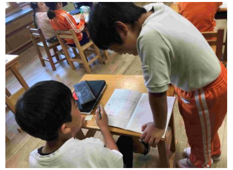
▲授業では、難しい問題に主体的に取り組もうとする姿が見られました。