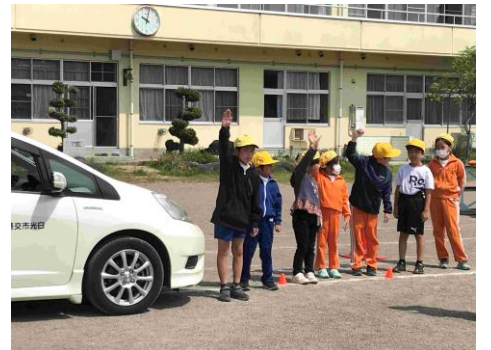
▲新しい登校班や交通安全教室などで、安全な行動を再認識しました。