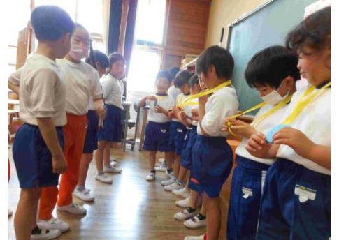
▲「一年生を迎える会」や「なかよしの会」で、嬉しさを共有しました。