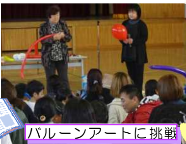
バルーンアートに挑戦