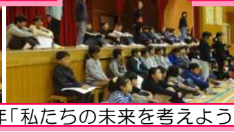
4年「私たちの未来を考えよう！」