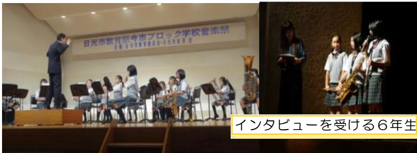
インタビューを受ける6年生

11月2日（金）今市ブロック学校音楽祭に、本校吹奏楽部の児童が参加し「茶色的小びん 他」を演奏しました。高学年のパートリーダーが中心となり、これまで下級生を引っ張って練習してきました。全員で力を合わせ、息の合った堂々とした演奏を披露できたと思います。