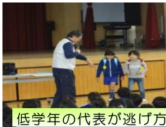
低学年の代表が逃げ方を教えてもらいました