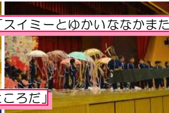
5年「教室はまちがうところだ」