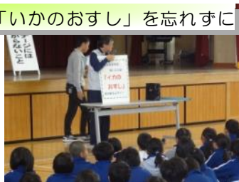
「いかにおすし」を忘れずに