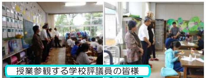
授業参観する学校評議員の皆様

7月6日(金)本年度第1回目の学校評議員会が開催されました。評議員の皆様には、各学級の授業を参観していただくとともに、学校経営の方針、学校の危機管理、教育課程等について、貴重なご意見をいただきました。 一年間、どうぞよろしくお願いいたします。