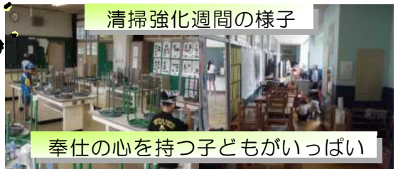
清掃強化週間の様子