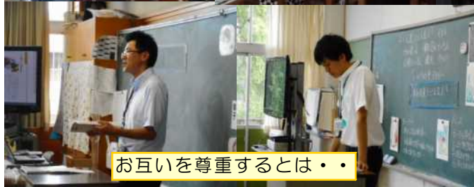
お互いを尊重するとは・・・