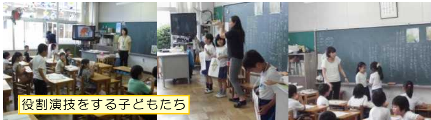
役割演技をする子どもたち