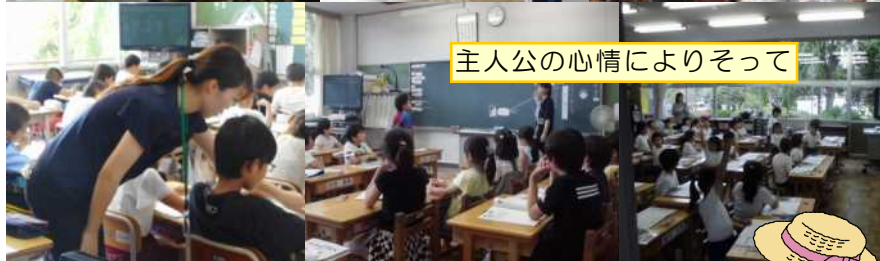
主人公の心情によりそって