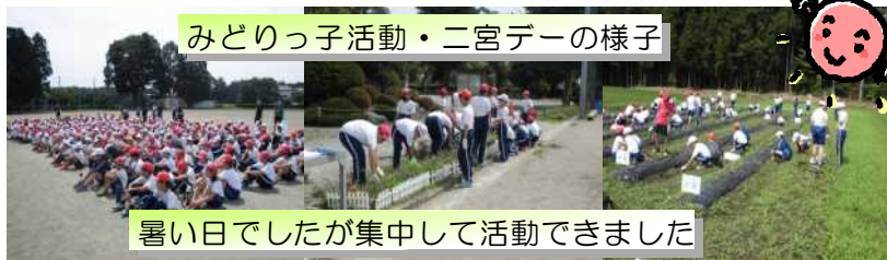
みどりっ子活動・二宮デーの様子