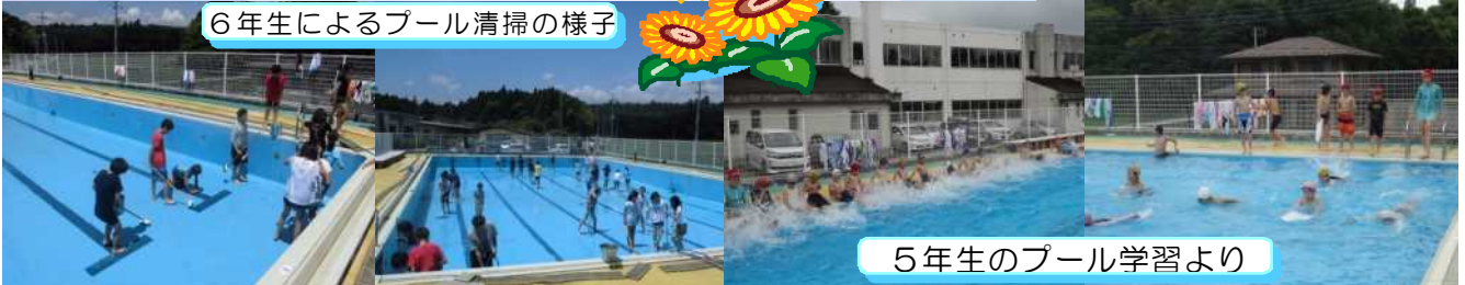
5年生のプール学習より