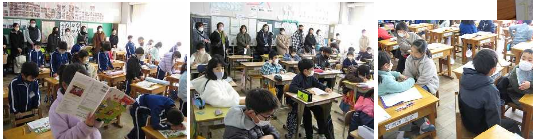
【授業参観のようす】