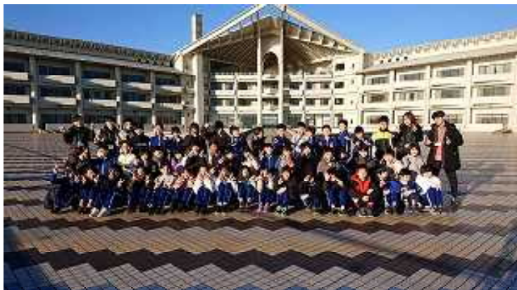
【メイン広場にて（日の出を見た後）】