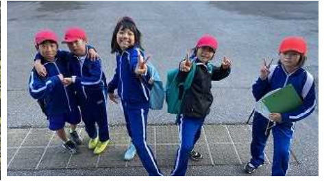
【ウォークラリーより】