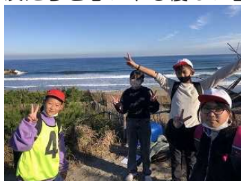
【海浜探検オリエンテーリング】

12月7日から9日までの3日間、5年生が茨城県にある「とぎぎ海浜自然の家」にて、臨海自然教室を行いました。晴天に恵まれ予定していた活動を無事実施することができました。活動を通して、友だちを思いやる優しい言動と進んで協力する姿勢がみられ、5年生の大きな成長を感じました。