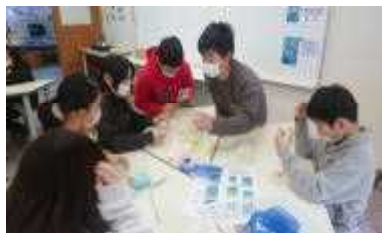
【ジェルキャンドルづくり】