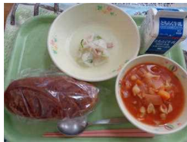
1位 ココア揚げパン