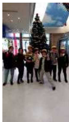
【大洗わくわく科学館】