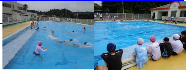
【プール開き：6年水泳指導】

※ 質問等ございましたら、学校までご連絡ください。【TEL 26 - 0004】