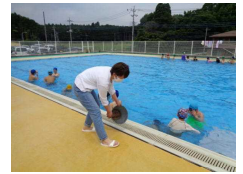
【水泳ボランティアさん】

夏休み期間中につきましては、混雑が予想され、確実な安全確保が難しいことから、プールの開放は行いません。ご了承いただきますようお願いいたします。