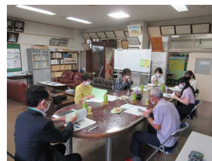
【昨年度学校評議員会より】