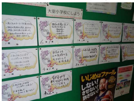
【学級ごとのテーマ（職員室前に掲示）】

11月29日（月）～12月3日（金）にかけて「なかよし週間」を行いました。「世界人権デー」にあわせてこの時期に実施しています。①学級ごとにテーマを掲げ全員で人権に配慮した行動を行うこと、②人のよいところに目を向け「ありがとうカード」を作成すること、③道徳の時間を充実することの三つに力を入れて実践しました。人のよい面を見ていこうとする態度が見られました。