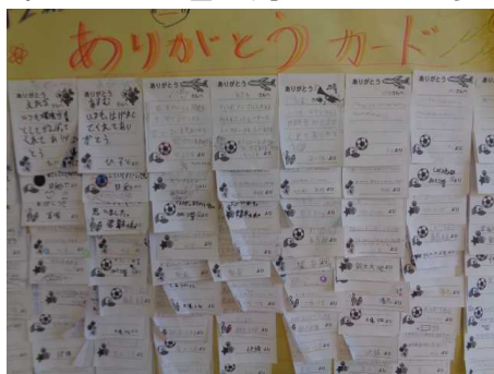
【ありがとうカード】