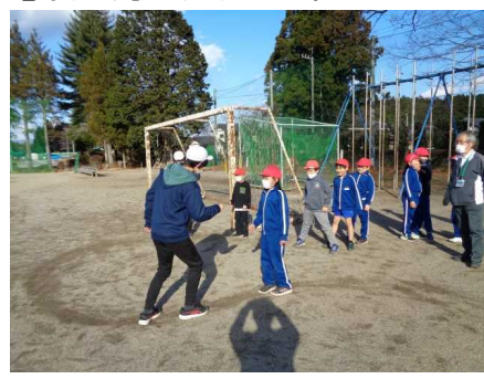
【12月22日：共遊の時間より】