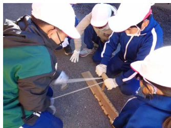
【火おこし体験と米炊き体験】