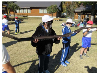
【仲間づくりゲーム】

11月25日（木）～26日（金）にかけて、4年生が鹿沼自然体験交流センターにて宿泊学習を行いました。1日目は仲間づくりゲーム、アスレチック、ウォークラリー、星空観測、キャンプファイヤーを行いました。2日目は、火おこし体験とカレー作りを行いました。「できる部分は、自分たちの力で協力してやる。」そんなめあてを達成できた2日間になりました。4学年保護者の皆様、お忙しい中事前の準備等、ご協力ありがとうございました。