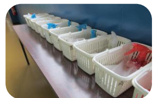
職員用校内消毒セット