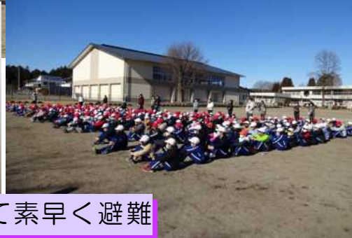
「指示を聞いて」黙って素早く避難