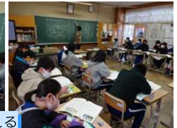
思い通りにならないこと、どうやって乗り越える

2月1日（月）道徳の授業が公開され、多くの先生方が参観しました。資料は、感染症が発生し、来園者が激減してしまった北海道旭山動物園の飼育員さんたちが、市民に愛される動物園を目指してアイデアを出し合い、理想の動物園を作り上げようと努力し、日本中から愛される動物園を作り上げた実話でした。子どもたちは、自分たちがいろいろな夢を持っていることを発表し合い、うまくいかなかったり、失敗することのつらさを共感的にとらえました。そして、資料の主人公たちの姿を通して、それでも自分の夢の実現のためには、夢をあきらめないことや、困難を乗り越える強い意志を持ち、努力していくことが大切なのだと感じていたようです。中学校進学が間近に迫った6年生、中学校ではこれまで以上に勇気や強い意志が求められると思います。ぜひ、心の強い中学生を目指して頑張ってもらいたいと思います。