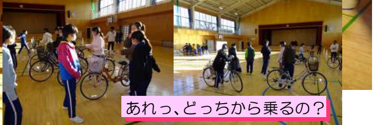
あれっ、どっちから乗るの？

2月8日（月）例年ですと、日光市生活安全課や交通指導員の方々にご指導いただく自転車安全教室ですが、本年度は新型コロナウイルス感染症による緊急事態宣言の発出等のため、学校内での実施となりました。中学校では自転車通学となる子も多く、今回改めて自転車の簡単な法規やルール、安全走行等の実技を実習しました。自転車は遊び道具ではなく、道路交通法では立派な軽車両です。また、これからは学用品のバッグや部活動の用具が入ったバッグを積載しての運転となるので、慣れないうちは多くの危険が伴います。ぜひ、全員が交通ルールを理解し、正しい自転車の乗り方ができるようになって欲しいと思います。