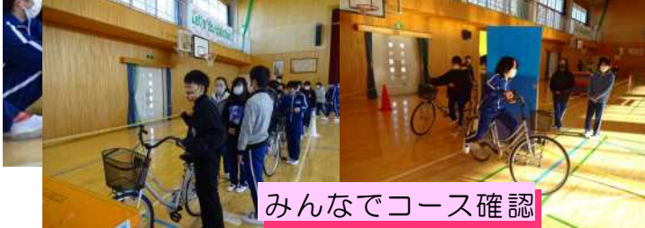
みんなでコース確認