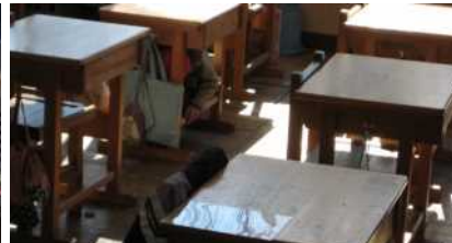
「おかしも」で命を守る