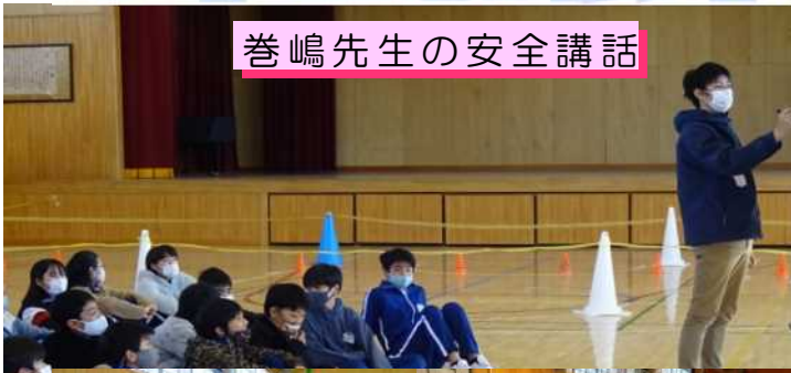
巻嶋先生の安全講話