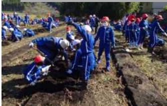
6年生が1年生のお手伝い

10月29日(木)みどりの少年団活動の一環として、さつまいもの収穫を行いました。苗植えから収穫まで、PTA環境緑化部の方々や学校の用務員さんによる除草作業、6年生によるつる切り等を含め、大変お世話になりました。多くの皆様のご協力により、今年もすばらしい豊作で、子どもたちは大喜びでした。残念ながら、今年度は地域の敬老会の皆様とのふれあい活動としての実施はできませんでしたが、次年度に期待したいと思います。低学年児童から順番に全校生で分け合い、全員数本ずつ持ち帰ることができました。6年生が中心となり、児童が力を合わせて育て・収穫した秋の味覚、ご家庭でご賞味いただけたでしょうか？