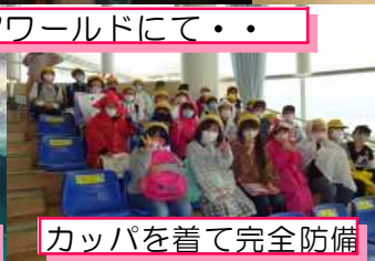
カッパを着て完全防備