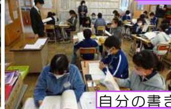
自分の書きたい主張は？