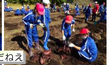
うーん、大漁だねえ