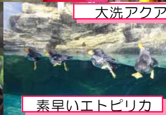
素早いエトピリカ