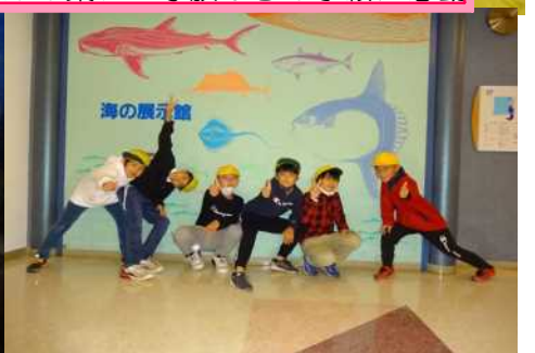
イルカの攻撃体勢