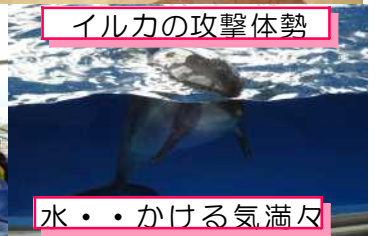
水・・・かける気満々