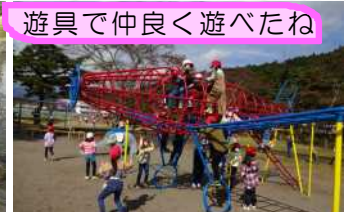
遊具で仲良く遊べたね