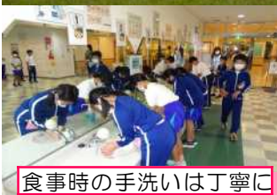
食事時の手洗いは丁寧に