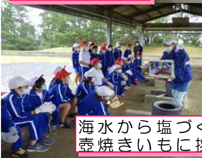
海水から塩づくり 壺焼きいもに挑戦