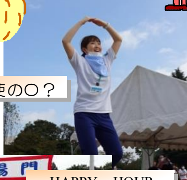
ダンス dance ダンス