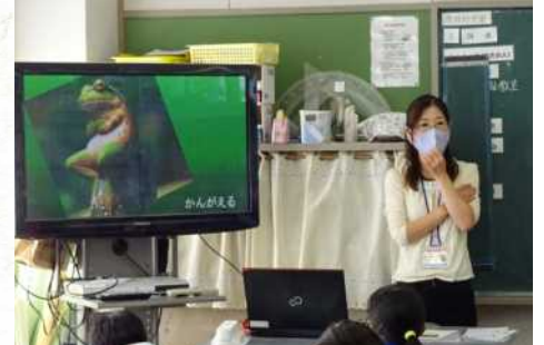
喫煙防止教室、みんなで考えましょう