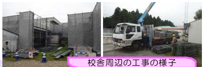
校舎周辺の工事の様子

現在、校舎の屋根と外壁の改修工事中です。工事車両の出入りや、工事に係る騒音など、皆様のご理解・ご協力をお願い申し上げます。