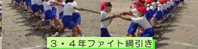
3・4年ファイト綱引き