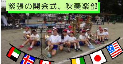
緊張の開会式、吹奏楽部

天候にも恵まれ、9月12日(木)PTAをはじめ多くの皆様のご協力により、令和元年度の秋季大運動会を無事に開催することができました。多くの方々より、子どもたちの真剣な姿に称賛の声をいただきました、お世辞抜きに素晴らしい運動会だったと思います。6年生が中心となって盛り上げた運動会、特に組み体操のクオリティはその感動を言葉にすることは難しいほどでした。全員が勝利をこえる喜びを感じ取れたことでしょう。お忙しい中、多くのご来賓の方々、地域の皆様にご来校いただき、たくさんの温かい応援を賜りましたこと、心より感謝申し上げます。