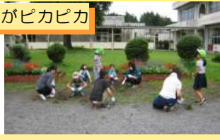
早朝より多くのご参加ありがとうございました