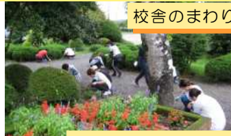
校舎のまわりがピカピカ