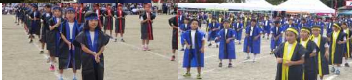
ダンス☆大室の勲章☆(くんしょう)