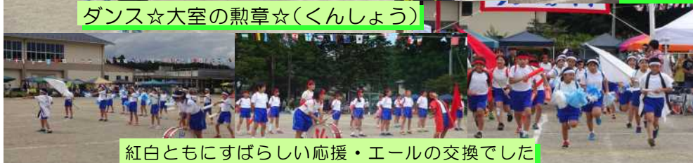
紅白ともにすばらしい応援・エールの交換でした