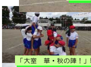
「大室 華・秋の陣!」騎馬戦