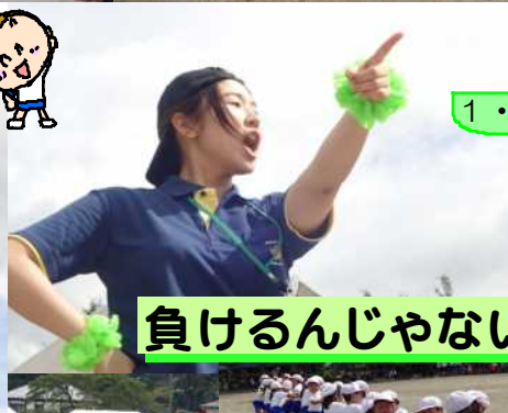
負けるんじゃないわよ!!