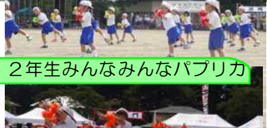
1・2年生みんなみんなパブリカ