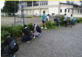
運動会に向けてみんな熱心に

運動会に向けた環境整備のために、8月31日（土）にPTAの奉仕作業を実施していただきました。150名ものPTAの皆様にご協力いただき、校庭や学校周辺、例年運動会駐車場としてお借りしている空き地の除草、樹木の剪定などをお手伝いいただきました。今年は子どもたちの参加・協力者が多く、児童と保護者の皆様の力を結集した作業のおかげで、学校のまわりがとてもきれいになりました。ご協力ありがとうございました。