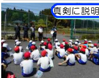
真剣に説明を聞きます

お忙しいところご指導下さいましたグループの皆様、JA職員の皆様、大変お世話になりました。今後とも、よろしくお願い致します。