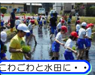
こわごわと水田に・・・