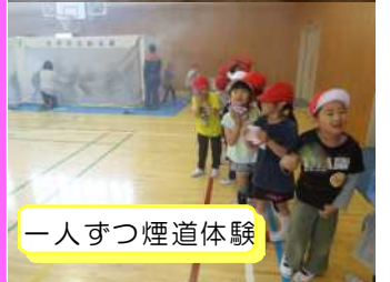
一人ずつ煙道体験