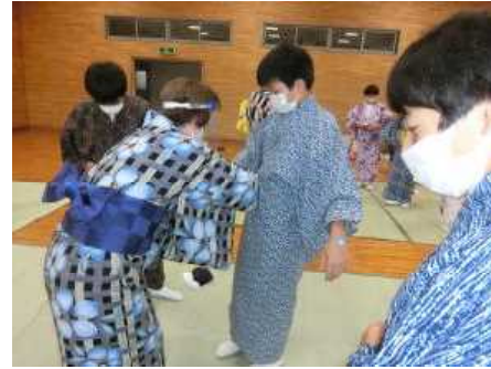
▲自分で浴衣を着ることに挑戦!