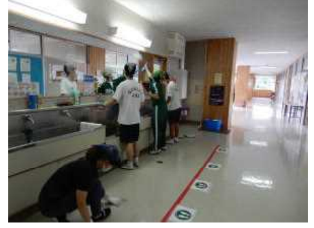
▲水道周りを念入りに掃除