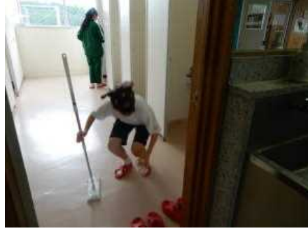
▲トイレの床を念入りに掃除