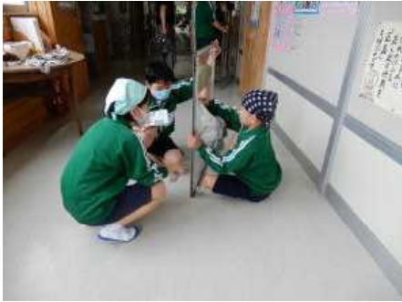
▲廊下の窓ガラス磨き

各清掃場所の班長が中心となり重点的に取り組む箇所や内容を決め、真剣に清掃に取り組んでいます。