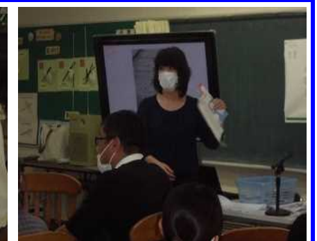
【授業研究会・講演会の様子】