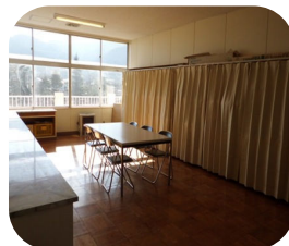
ボランティア・ルーム