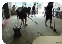
放送室のカーペット撤去作業