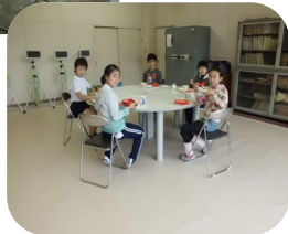
きれいになった放送室で給食