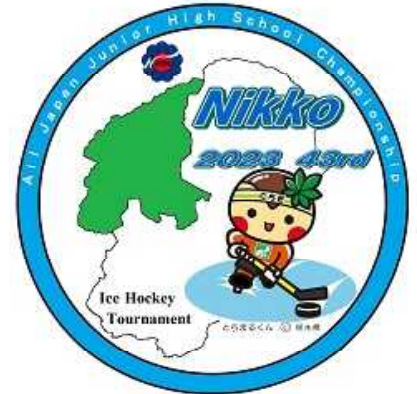
《大会シンボルマーク》