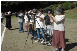
保護者の方々も熱心に