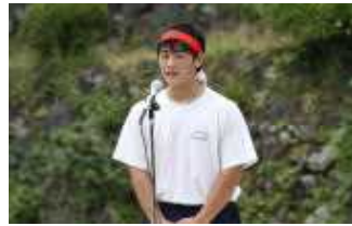
実行委員長のあいさつ