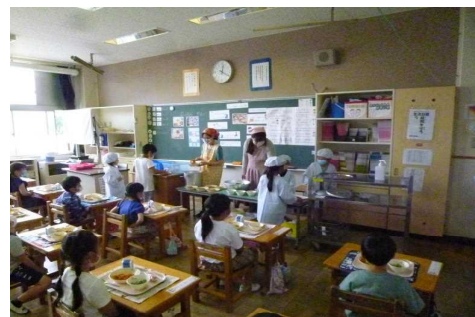
【給食配膳のようす(1年生)】

1学期は7月末までとなり、授業日は約2か月ではありますが、充実した学習となるよう取り組んでまいります。