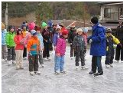
滑走のコツを聞く

スケート学習は1月いっぱい続きますが、それぞれの学年の目標が達成できるよう指導していきます。よろしくお祈りします。