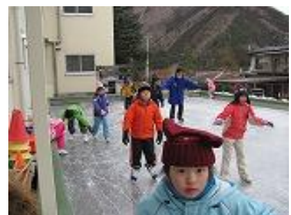
周回練習で氷に慣れる