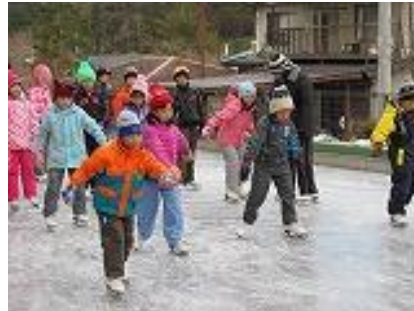
バランスをうまくとって