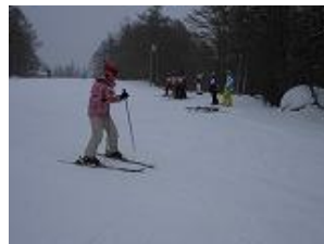
きれいなプルーク