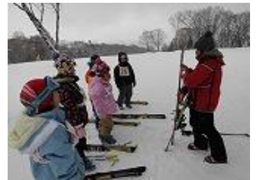
用具の説明を聞く