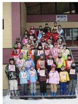
そろっての記念撮影

午後になると雪に慣れ上手に斜面を滑り降り、 スキーの楽しさを味わうことができました。お世 話になったスキー場及びスクールの皆様や、PT A保健体育委員会の皆様には感謝いたします。