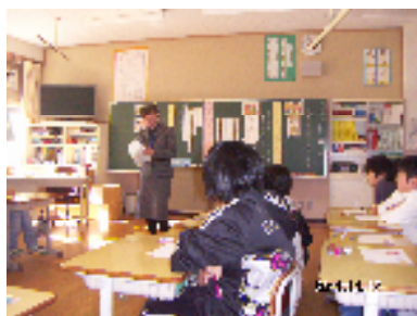
←5年生の 研究授業の様子

5年生は、「くずれ落ちただんボール箱」という資料を使って、「親切」について真剣に考えることができました。放課後には、児童の心に響く道徳の授業を目指して、全職員で授業研究会を行いました。