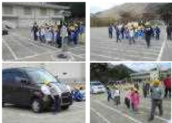
右見て!左見て!気をつけて! 4/25