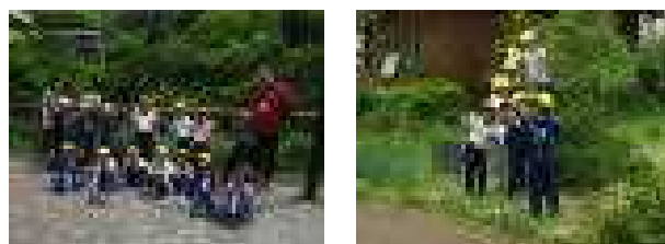
滝見公園でパチリ!ピースでパチリ! 5/12