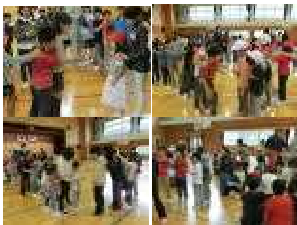
楽しく!仲良く!はじける笑顔! 5/11