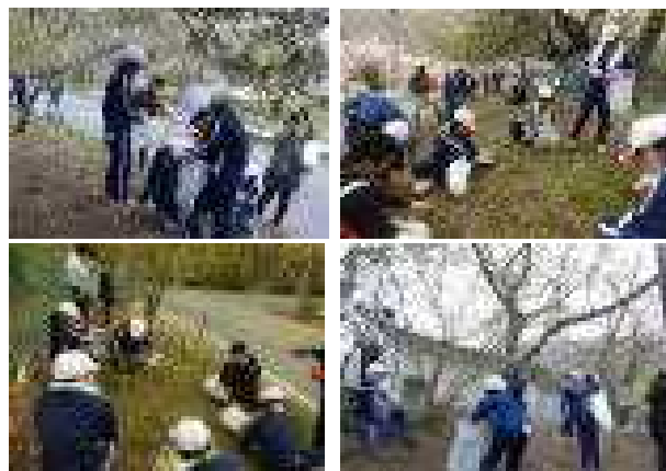
地域の人と協力して頑張りました! 4/26