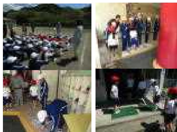
すみやかに!安全に!自分を守る! 4/28