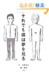
「それでも僕は夢を見る」