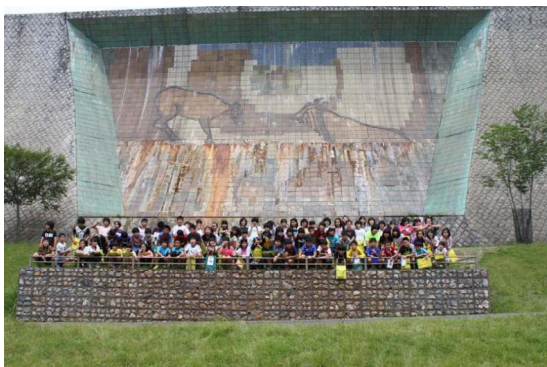
砂防ダムの大きな壁画の前で

学校を出発する時はどんより曇っていましたが、日足トンネルを抜けたら、青空が広がっていました。天候に恵まれて、環境学習センター、足尾銅山観光、足尾歴史館の3カ所を楽しく回ってきました。環境学習センターでは、足尾の緑を取り戻す取り組みについて、足尾銅山観光では銅山の歴史を、足尾歴史館では銅山で栄えた町の様子を学びました。