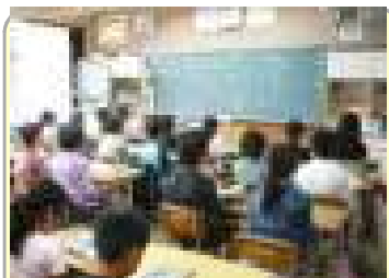
朝学の前に、立腰タイム

六月六日（金）に学校支援地域協議会を開催いたしました。当日は雨で足元の悪い中、たくさんの方にお集まりいただきました。とても有意義な時間を持つことができました。本当にありがとうございます。