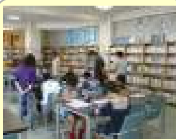
たくさんの先生に見守られてサンサン学習