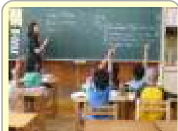
少ない人数で元気に算数