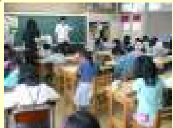
チャレンジかけ算満員御礼