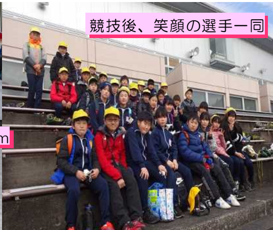
競技後、笑顔の選手一同