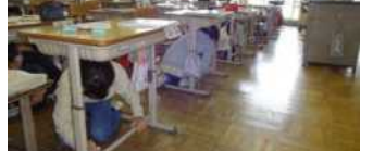
素早く机の下に避難できました