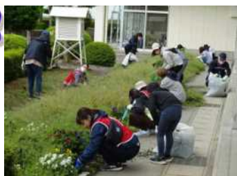
草だらけの花壇が美しく変身

5月15日(日) 本年度第一回のPTA奉仕作業、大変お世話になりました。校庭整備・側溝の清掃、花壇や農園・プールの除草と整頓、校舎内の清掃等、普段なかなか手の届かない所まで綺麗にさせていただきました。お忙しい中、多くの皆様のご参加に心より感謝申し上げます。ありがとうございました。