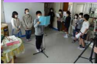
代表委員による中継の様子

5月6日(金)、児童会主催で「1年生お迎えの会」を実施しました。今年もコロナ対策のためオンライン中継でのスタート。代表委員会のみなさんが、今三小クイズなどのゲームを披露して楽しませてくれました。その後、上級生たちが廊下に並んで迎える中、1年生は代表児童の先導で校舎内を回り、上級生からたくさんの祝福の拍手をもらってうれしそうでした。先輩の2年生からは、昨年2年生が育てたアサガオの種のプレゼントをもらいました。上級生の皆さん、登下校班・清掃班で、委員会や係活動で、休み時間など、これからも1年生にいろいろなことを優しく教えてあげてください。