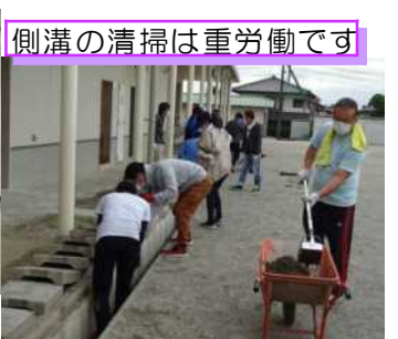
側溝の清掃は重労働です