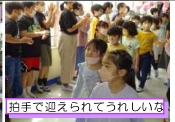
拍手で迎えられてうれしいな