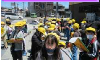
良い天気で絶好の探検日和

5月10日(火)、3年生が社会科の学習で、学校の周りの様子を調べに行きました。学校の周りとはどのような地形になっているのか、どんな建物があるのかを、千本木方面と小倉5丁目方面に分かれて調べました。これからのまとめが楽しみです。