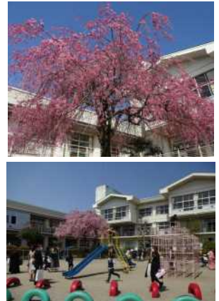
校長室前の枝垂れ桜が満開

4月8日（金）、令和4年度第1学期の始業式を迎えることができました。やっとな栃木県のまん延防止等重点措置が解除され、この一年に対する大きな期待を抱いて登校する子どもたちの姿が、とても頼もしく感じられました。しかし、日光市内においても依然新型コロナウイルスの感染者が多い状態です。児童・保護者・教職員みんなで新しい生活様式を徹底し、今後とも一丸となって感染拡大を防いでいけるよう、ご理解・ご協力をお願い申し上げます。学校といたしましては、出来る限りの安全対策を講じつつ、通常の教育活動実施に向けて、工夫していきたいと考えています。しかし今後の状況によっては、急な変更や対応の必要性も考えられます。その際は、メール配信や学校ホームページにてお知らせします。今年度も、皆様のご理解・ご協力を重ねてお願いいたします。