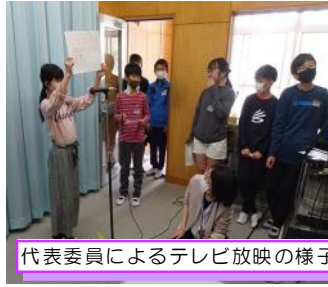
代表委員によるテレビ放映の様子

5月7日(金)、児童会主催で「1年生お迎えの会」を実施しました。コロナ対策のため校内テレビでの放映からスタート。代表委員会のみなさんが、今三小クイズや早口言葉などのゲームで楽しませてくれました。その後、上級生たちが廊下で迎える中、1年生は担任の先生の先導で、学校内を回り、上級生から祝福の拍手をもらってうれしそうでした。アサガオの種まきも終わり、小学校生活も軌道にのってきました。上級生の皆さん、登下校班・清掃班で、委員会や係活動で、休み時間など、これからも1年生にいろいろなことを優しく教えてあげてください。