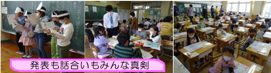
発表も話し合いもみんな真剣

4月28日（水）、授業参観を実施しました。今年も新型コロナウイルス感染症対策で密を避けるために、地区単位で参観時間を割り振らせていただきました。公私ともにいろいろとご都合がおりの中、ご協力いただきありがとうございました。各学年ともに、発達の段階に応じた工夫した内容の授業をご覧いただけたのではないかと思います。おうちの方に授業を見ていただき、にこにこ顔の子どもたちがたくさんいました。また今回、PTA総会・学年懇談会ともに、資料配付により開催に替えさせていただきました。今後とも、ご協力くださいますようお願いいたします。