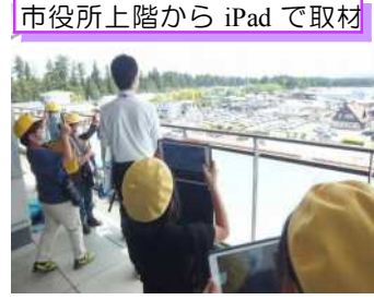
市役所上階から iPad で取材

5月10日(月)、3年生が社会科の学習で、学校の周りの様子を調べに行ってきました。学校の周りとはどのような地形になっているのか、どんな建物があるのかを、千本木方面と小倉5丁目方面に分かれて調べました。