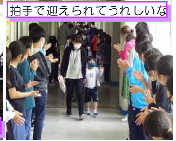
拍手で迎えられてうれしいな