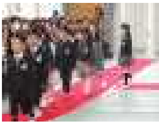
拍手に包まれて退場