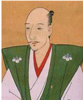
二人が行った政策