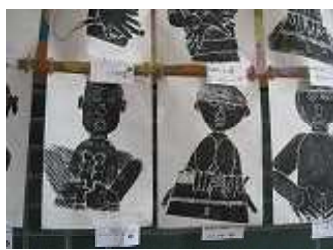
▲ 版画 (3年)