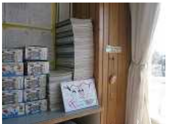
▲ 家庭学習の様子 (5年) ▲ 版画 (6年)