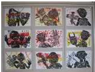
▲ 版画 (1年)

明日2月26日（水）は、今年度最後の授業参観及び学年部会です。授業の様子や学級内外の子供たちの作品等、学年部会における各担任からの説明を通して、この一年のお子様や学級、学年の子供たちの成長を感じていただけることと思います。