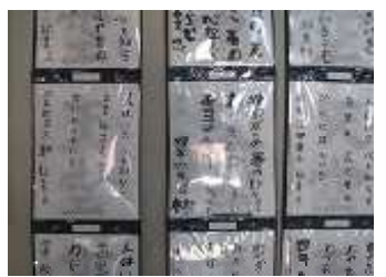
▲ 書写 (4年)