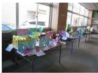
▲ 工作 (2年)