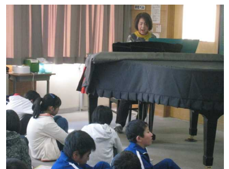
▲6年生音楽（卒業式の歌）