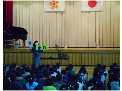
▲春の花と共に3学期がスタート (春の花：ろう梅、梅、菜の花など)