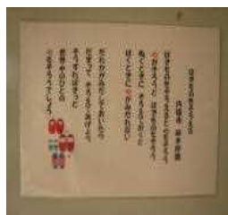
(児童昇降口に掲示)

はきものをそろえると 心もそろう 心がそろうと はきものもそろう ぬぐうときに そろえておくと はくときに 心がみだれない だれかがみだしておいたら だまってそろえてあげよう そうすればきつと 世界中のひとの 心もそろうでしょう