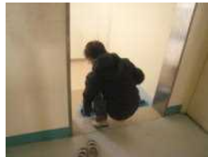
▲靴のかかとをそろえて入れている児童