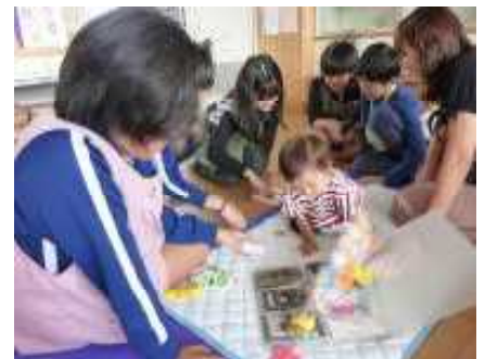
▲赤ちゃんから笑顔をもらいました