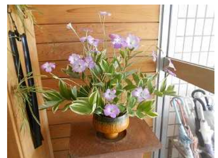
【玄関・昇降口の生け花(ボランティアさんによる)】