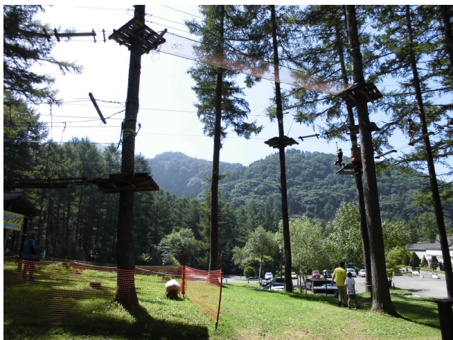
グリーンコース【110cm・11P 15分】