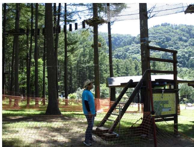
オレンジコース【140cm・19P 1時間】