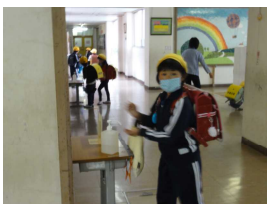
○登校時に手指を消毒!