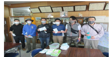
P 本部役員：朝の消毒作業