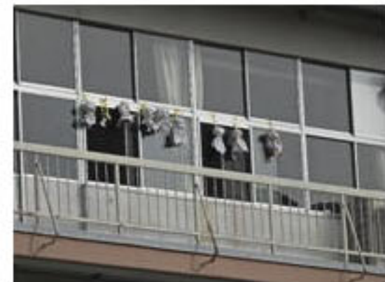
中学生作成のてるてる坊主がみんなを見守ります。

途中、閉校に向けたイベントとして人文字空撮やお楽しみ大抽選会もあり、真剣な中にもほのぼのとした小来川小中学校の校風を表したような、素敵な運動会になりました。今年は、児童生徒を合わせても16人なので紅白に分かれず、みんなが仲間として競技しました。地域の方々は従来通り地区別対抗で真剣な戦いを繰り広げました。