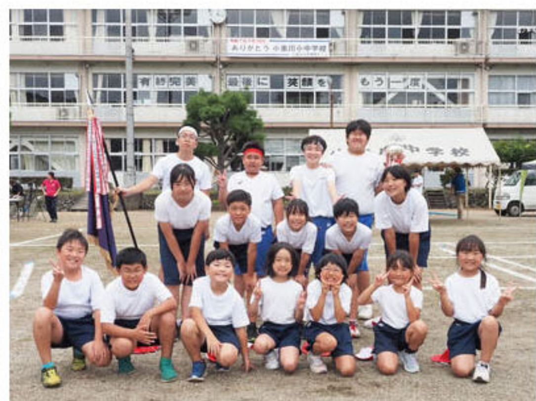
運動会が終わって笑顔