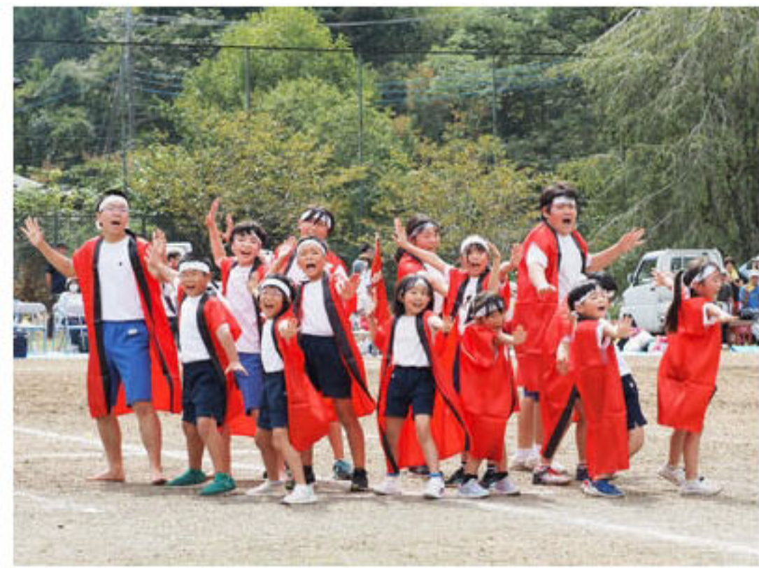
カッコいい南中ソーラン