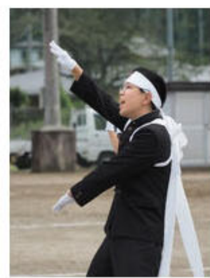
応援団長の力強い演舞