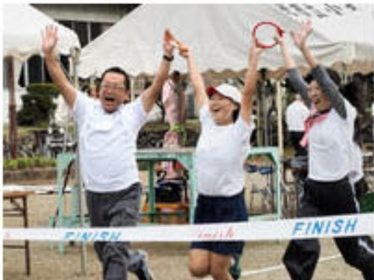
借り物競走や徒競走、綱引き、大玉転がし