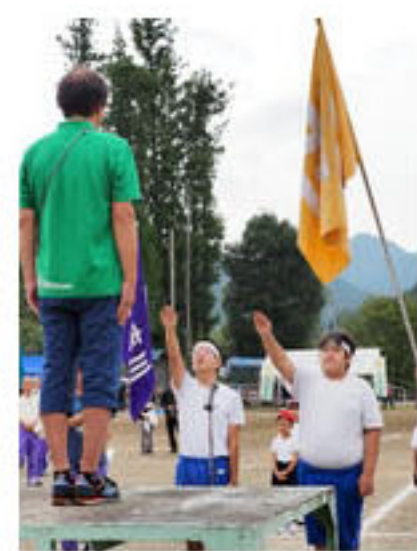
中2，中3による力強い選手宣誓。