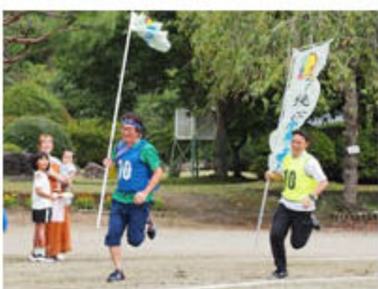
先生方も出場した地区別混合リレー