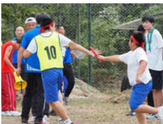
小中一緒の全校リレー