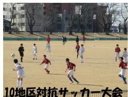
10地区対抗サッカー大会