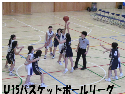
U15バスケットボールリーグ