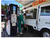
ENEOS 鬼怒川 SS