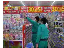
コマ×ビックカメラ 日光店