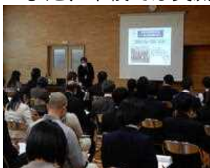
日光市教員研修会