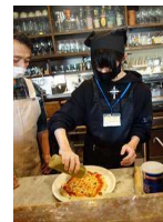
トラットリア・カミーノ