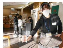
水辺のカフェテラス