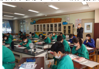
栗山中との交流授業