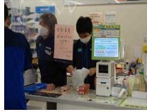
ファミマ日光高德店