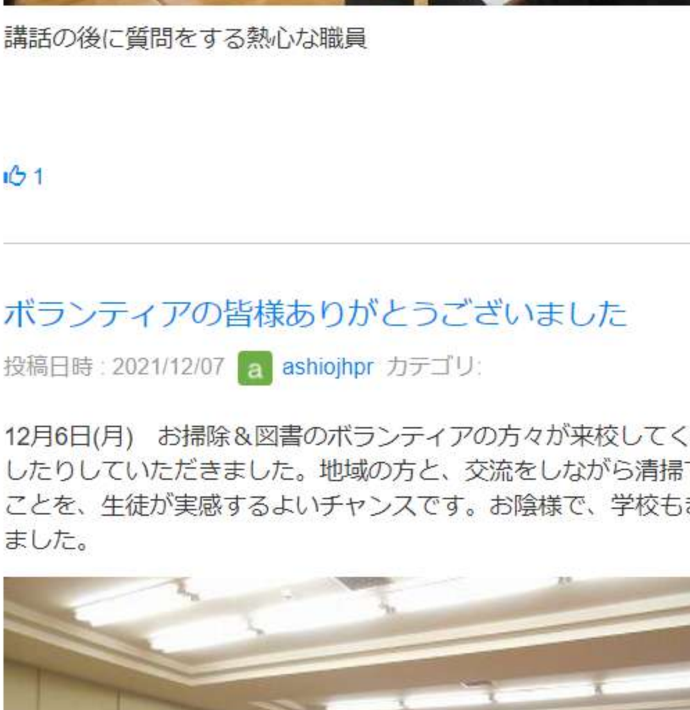
講話の後に質問をする熱心な職員