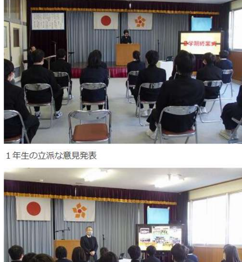
1年生の立派な意見発表

12月24日(金) 3校時に二学期終業式と生徒会役員任命式が行われました。終業式では、国家斉唱の後、1年生の意見発表、校長講話、校歌斉唱が行われました。その後、表彰伝達、生徒指導の話と続き、最後に生徒会役員任命式が行われました。旧役員の退任挨拶のあと、新役員に任命書が手渡されました。