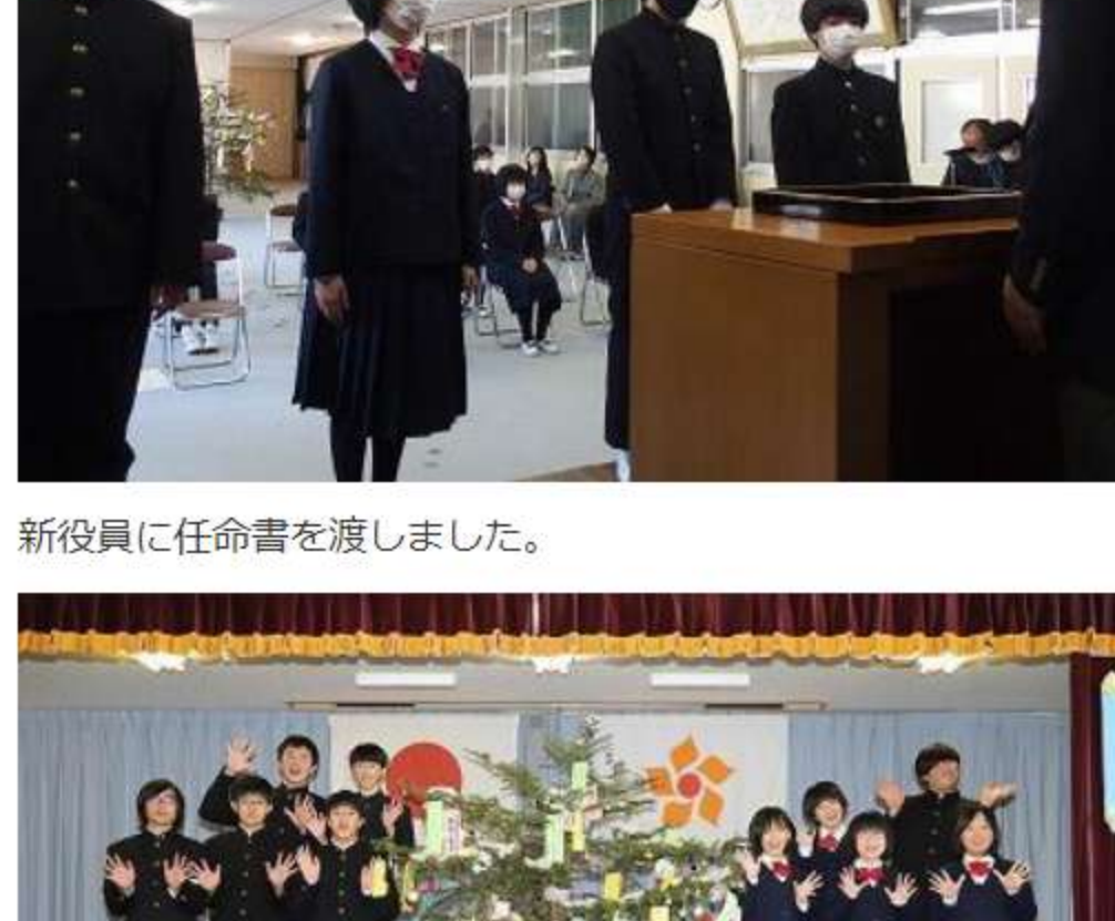
新役員に任命書を渡しました。