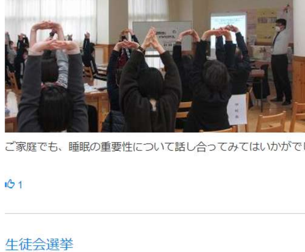
ご家庭でも、睡眠の重要性について話し合ってみてはいかがでしょうか。