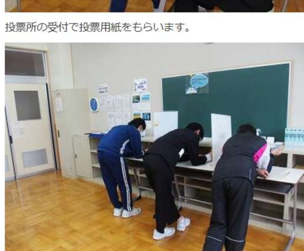
投票所の受付で投票用紙をもらいます。