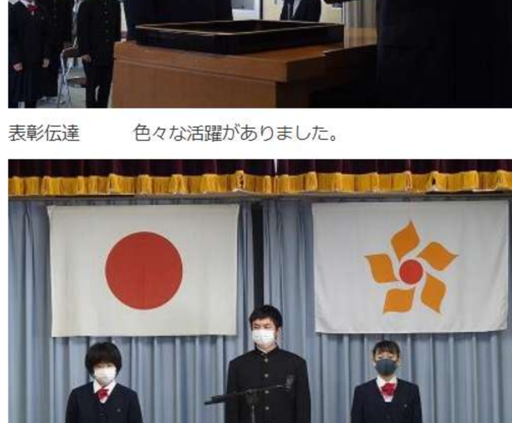
表彰伝達 色々な活躍がありました。