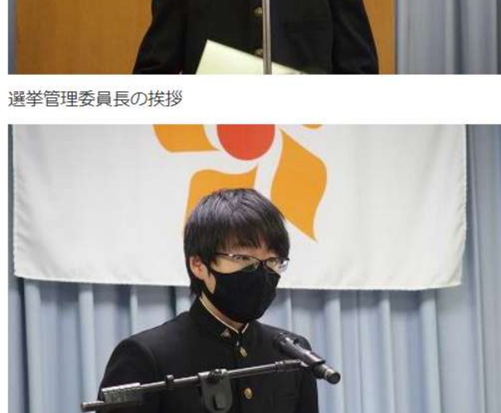
選挙管理委員長の挨拶

12月16日(木) 生徒会立会演説会と投票が行われました。立会演説会では、役員候補の7名が生徒会にける思いや、当選後の意気込みなどを堂々と発表しました。どの候補も素晴らしい発表ができました。その後、会場を移し、投票が行われました。投票の結果、役員になる生徒には、終業式に行われる任命式で任命書が渡されます。