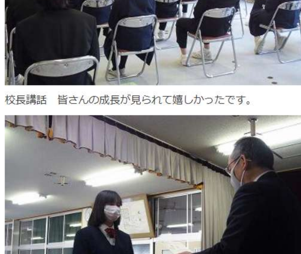
校長講話 皆さんの成長が見られて嬉しかったです。