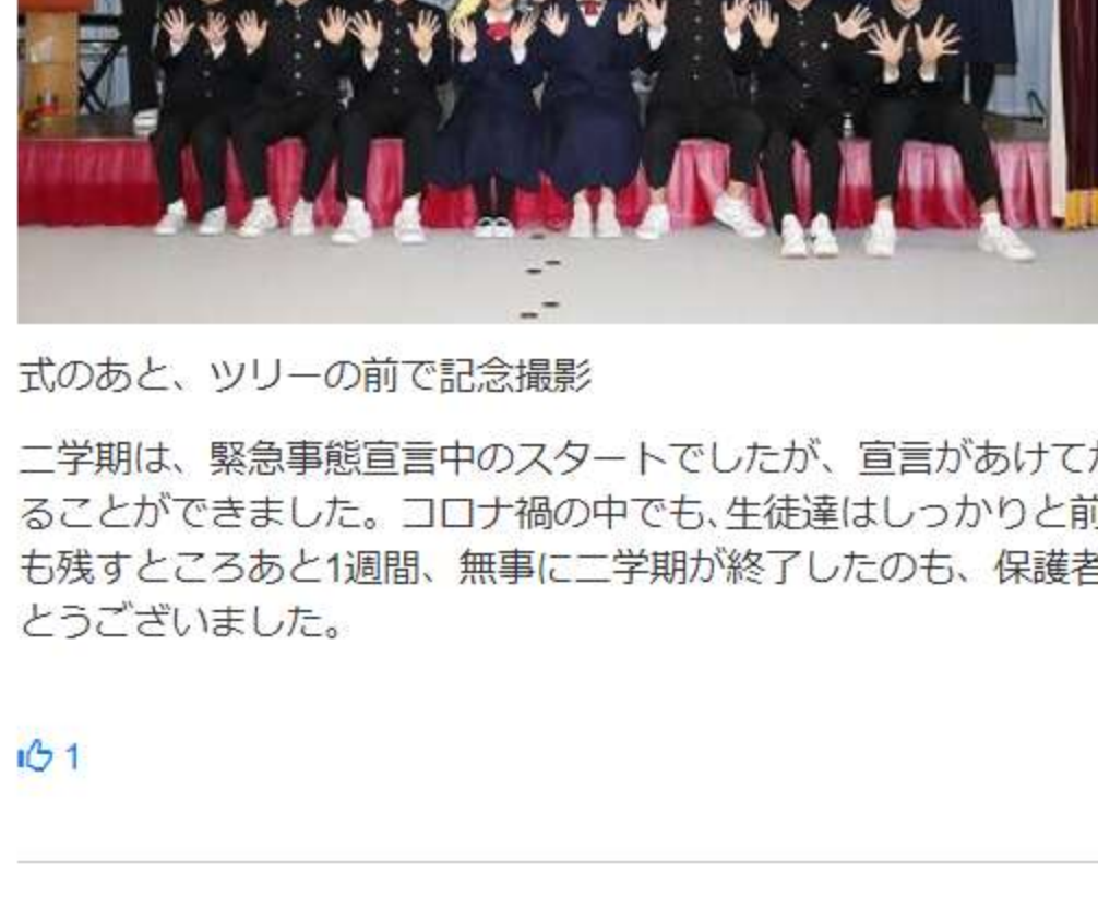
式のあと、ツリーの前で記念撮影

二学期は、緊急事態宣言中のスタートでしたが、宣言があけてからは、運動会や修学旅行、遠足、綱祭などの大きな行事を実施することができました。コロナ禍の中でも、生徒達はしっかりと前を向いて前進し、大きく成長した姿を見せてくれました。2021年も残すところあと1週間、無事に二学期が終了したのも、保護者の方々、地域の皆様のご支援・ご協力お陰です。本当にありがとうございました。