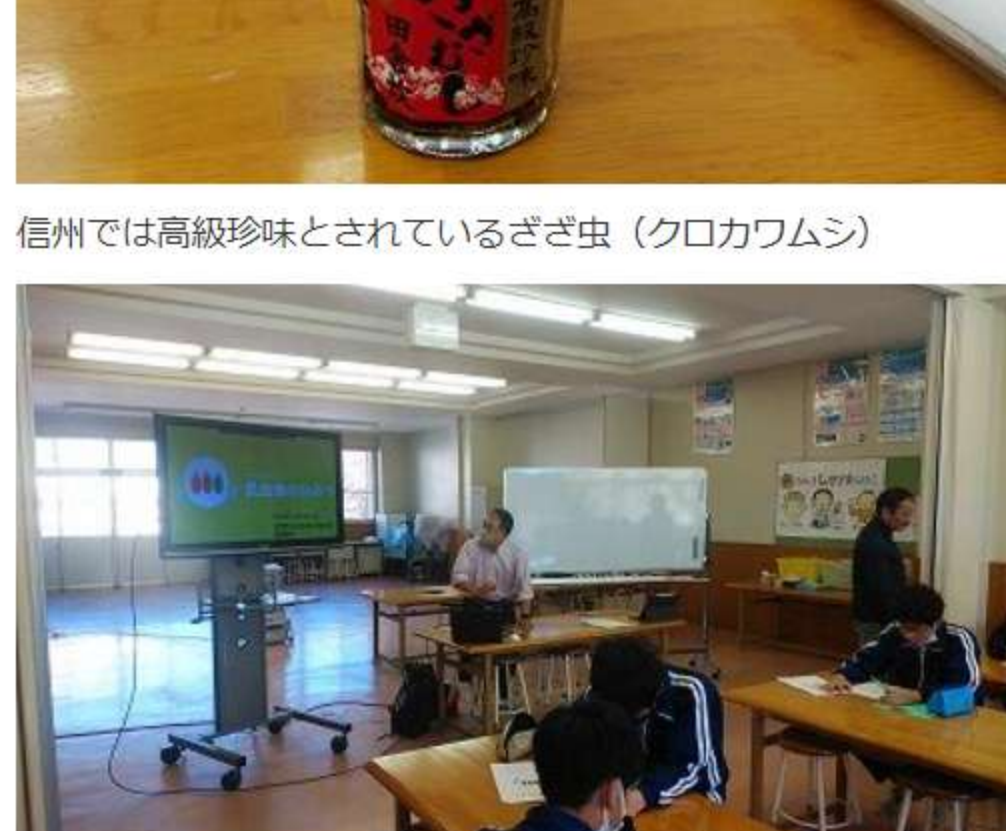
一般販売されている昆虫食の製品

12月14日(火) 総合的な学習の食育の学習で、学習院女子大学の先生2名をお招きして「昆虫食のひみつ」という授業をしていただきました。これからの食糧不足を解消するための食材として注目されている昆虫食ですが、昭和前半までは高タンパク質の食べ物としてどこでも食べられていました。金銭的に豊かな生活ができるようになり、昆虫を食べなくても高タンパク質が他の食べ物から摂取できるようになり、昆虫食は姿を消しつつあります。先生の講話、実際の試食（希望者のみ）を通して、このような問題について考えました。