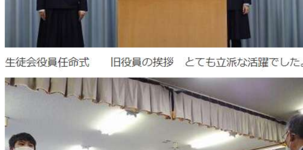
生徒会役員任命式 旧役員の挨拶 とても立派な活躍でした。