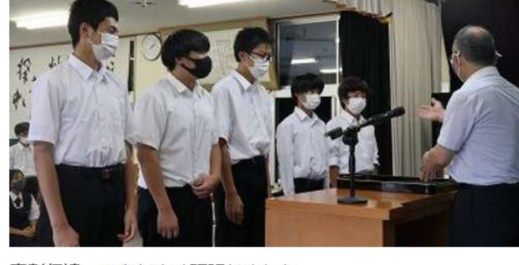
表彰伝達 みんなよく頑張りました。