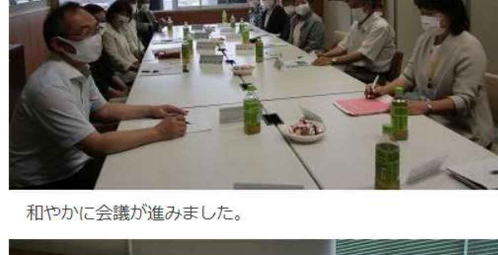
和やかに会議が進みました。

7月14日(水) 学校評議員・地域教育協議会の皆様にご来校いただき、令和3年度第1回足尾小学校・足尾中学校学校評議員会・地域教育協議会を開催しました。学校と地域の連携、地域と共に歩む学校づくりについて話し合いが行われました。