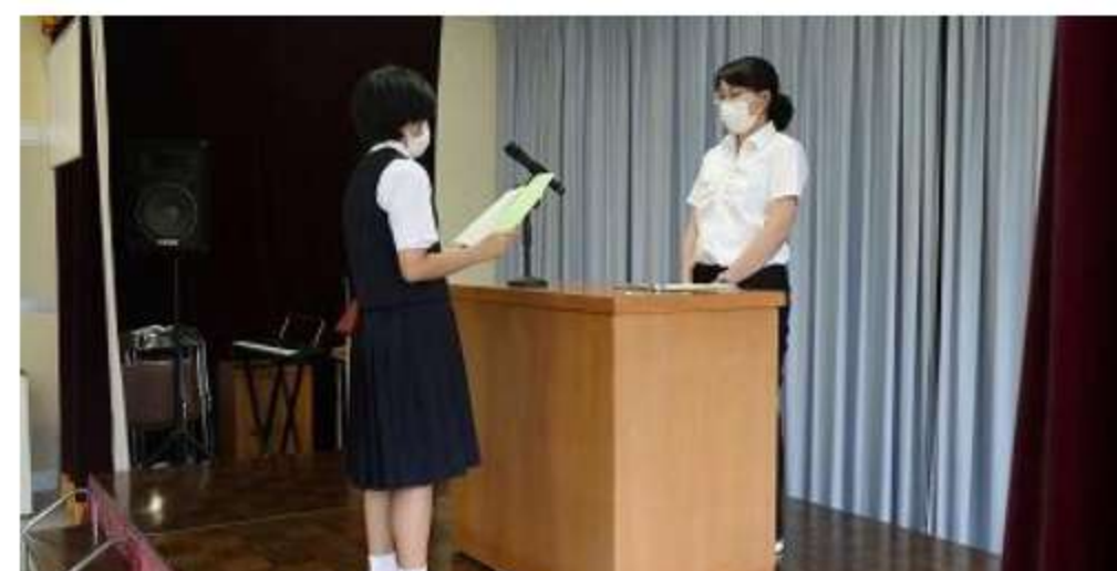
養護の先生の離任式です。