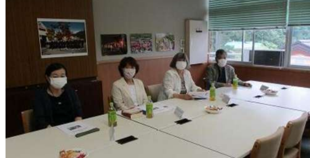
足尾中学校 学校評議員会・地域教育協議会の皆様