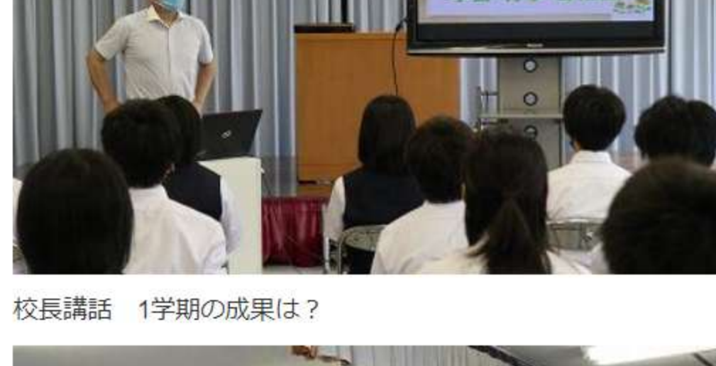
校長講話 1学期の成果は？