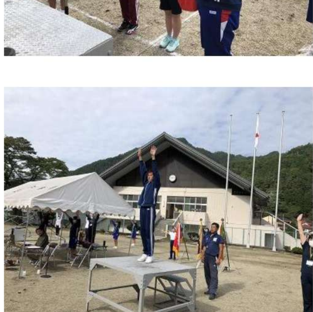
台風の動きは心配ですが、土曜日の運動会が今から楽しみです。