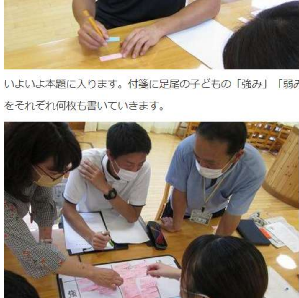
いよいよ本題に入ります。付箋に足尾の子どもの「強み」「弱み」をそれぞれ何枚も書いていきます。