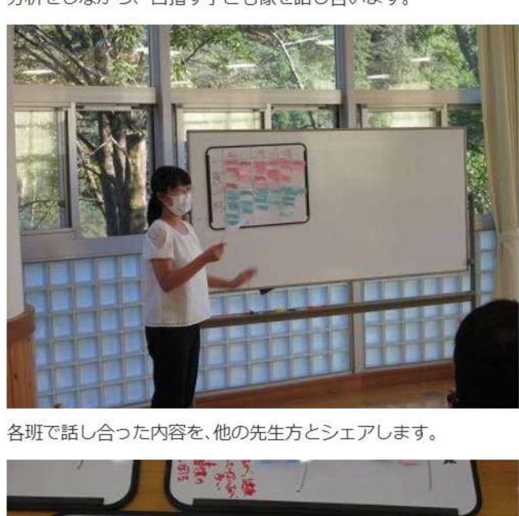
分析をしながら、目指す子ども像を話し合います。