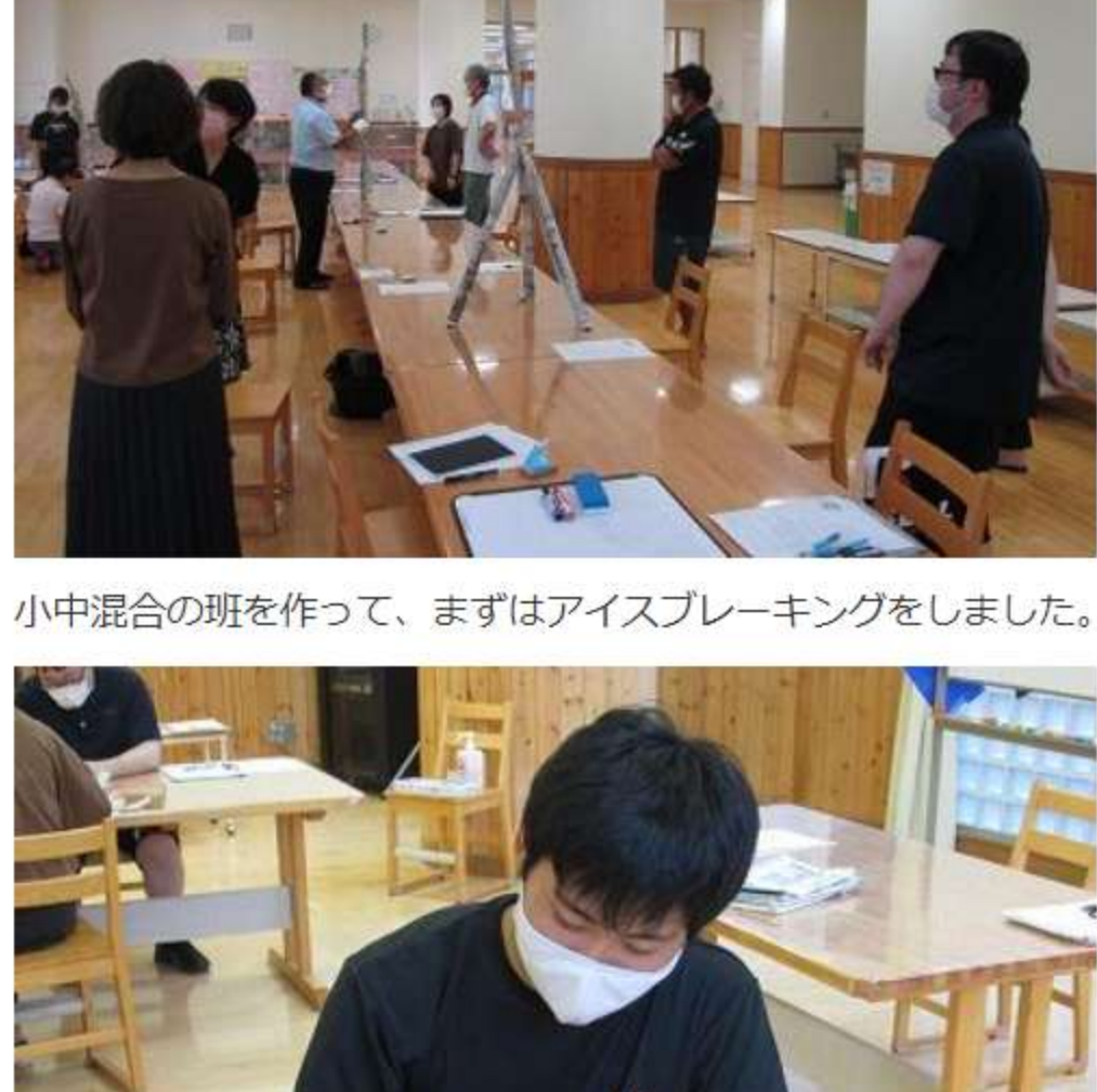
小中混合の班を作って、まずはアイスブレイキングをしました。

9月22日(水) 令和4年4月1日に小中学校が統合し、足尾小中学校になる準備が進められています。その一環として、教職員が「目指す足尾の子ども像」を共有するための合同研修会が、足尾小学校で行われました。研修会では、足尾の子どもの「強み」(伸ばしたいところ)「弱み」(付けたい力)を出し合って、それを分析しながら、私達教員が教育活動の中で目指していくところを検討しました。